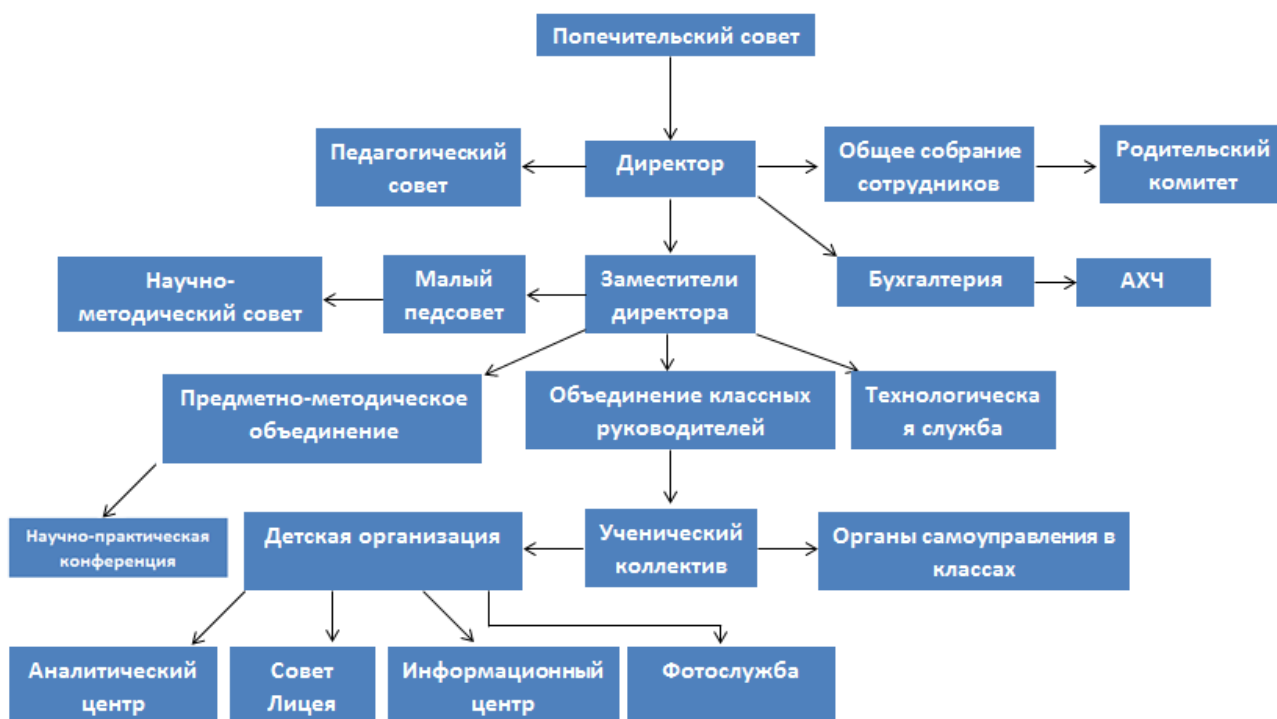
Фиг.1. Структура системы управления Лицея ТГУ

Органами управления Лицея ТГУ являются директор, зам. директора, объединение классных руководителей и ученический коллектив. Структуру, компетенцию органов управления Лицея, порядок их формирования, сроки полномочия и порядок деятельности определяет Устав Лицея.