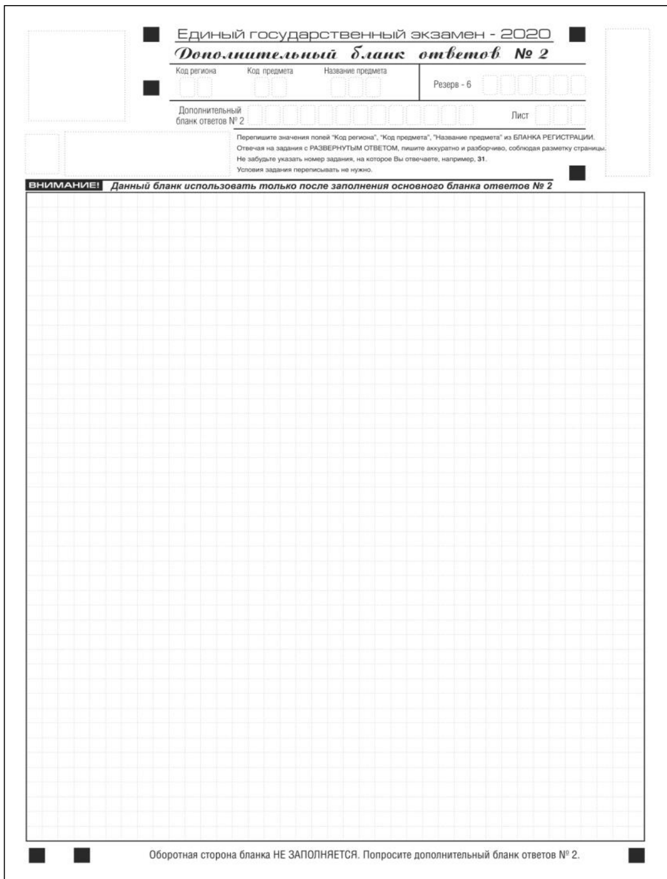
Рис. 15. Дополнительный бланк ответов № 2